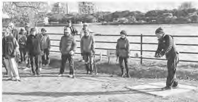
パークゴルフチャリティー大会