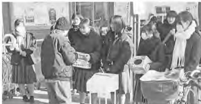
青豊高校インターアクトクラブ 豊前ロータリークラブ 街頭募金