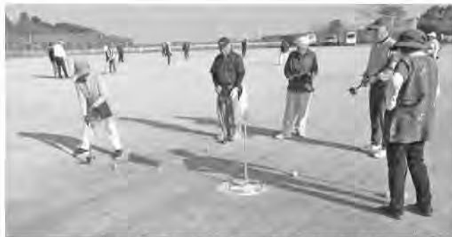
グラウンドゴルフチャリティー大会