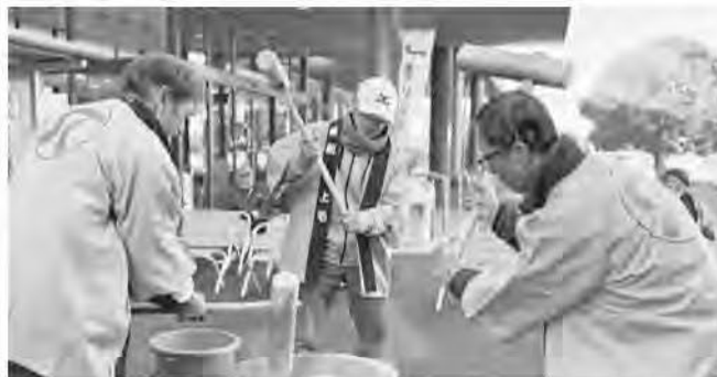
豊前・上毛シルバー人材センター餅つき大会