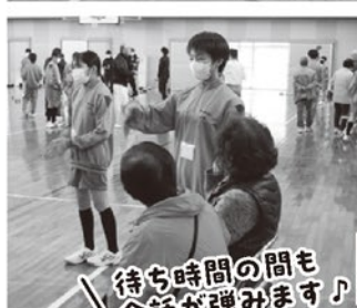
待ち時間の間も会話が弾みます♪