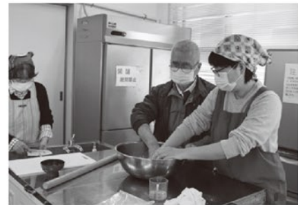
音声訳ボランティアこだまと 点訳ボランティアわかばが参加!