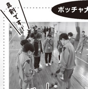
ボッチャ大会スタート