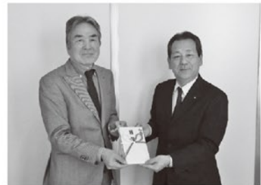
常務理事 黒木様から本会 会長へ