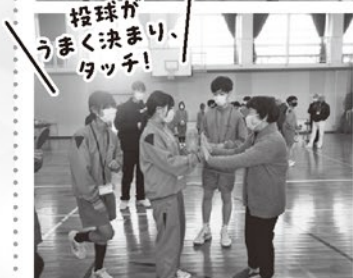
投げ球がうまく決まり、タッチ!