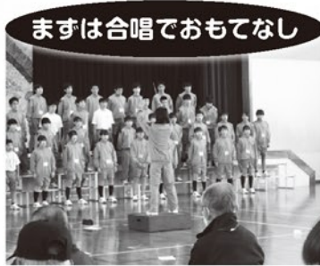
まずは合唱でおもてなし