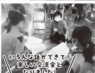
100人な話ができて、楽しい交流会となりました!