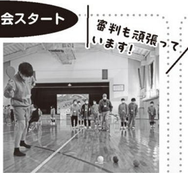
審判も頑張っています!