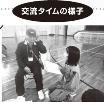
交流タイムの様子