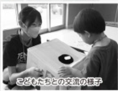
こどもたちとの交流の様子