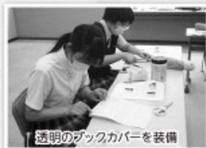
透明のブックカバーを装備