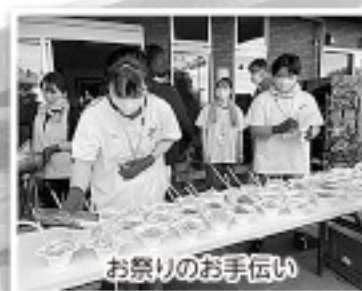
お祭りのお手伝い