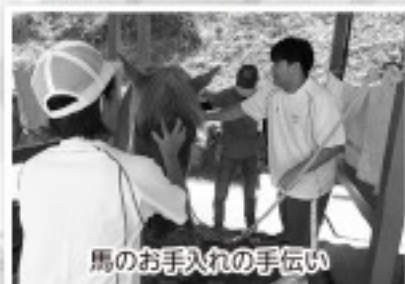
馬のお手入れの手伝い