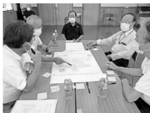
当事者の立場で話し合い