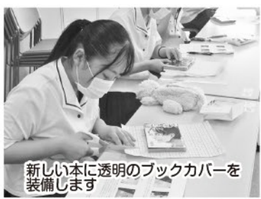
新しい本に透明のブックカバーを装備します