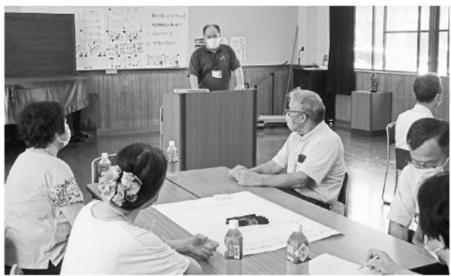
横武地区の現状と課題の話

自分らしく最後まで住み慣れた地域で暮らしたいと、誰もが願っていると思います。実現のために、今できることを地域の皆さんで考えることは、とても重要なことです。皆さんで考えた支え合いの地域づくりは、横武地域づくり協議会の計画に役立つことと思います。