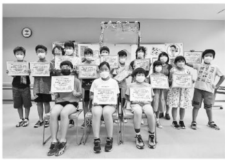
認定証を手に記念撮影！

9月3日(土)に開催された豊前語り部の会おはなし会、子ども語り部として語りを披露しました！昨年に引き続き2回目となった小学生対象の「子ども語りたい」講座に11名応募があり、おはなし会では昨年度認定者2名を加え、総勢13人で語りを披露しました。