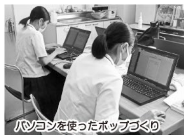
パソコンを使ったポップづくり