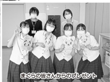
まぐらの皆さんからのプレゼント