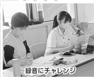
録音にチャレンジ