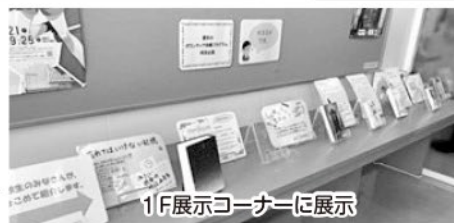
1F展示コーナーに展示