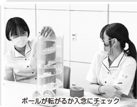
ボールが転がるか入念にチェック