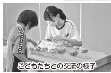
こどもたちとの交流の様子