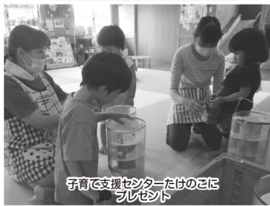
子育て支援センター向けのこに プレゼント