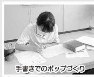
手書きでのポップづくり