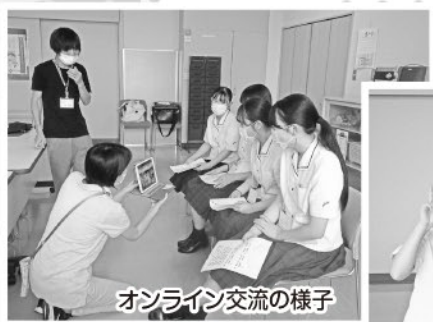
オンライン交流の様子